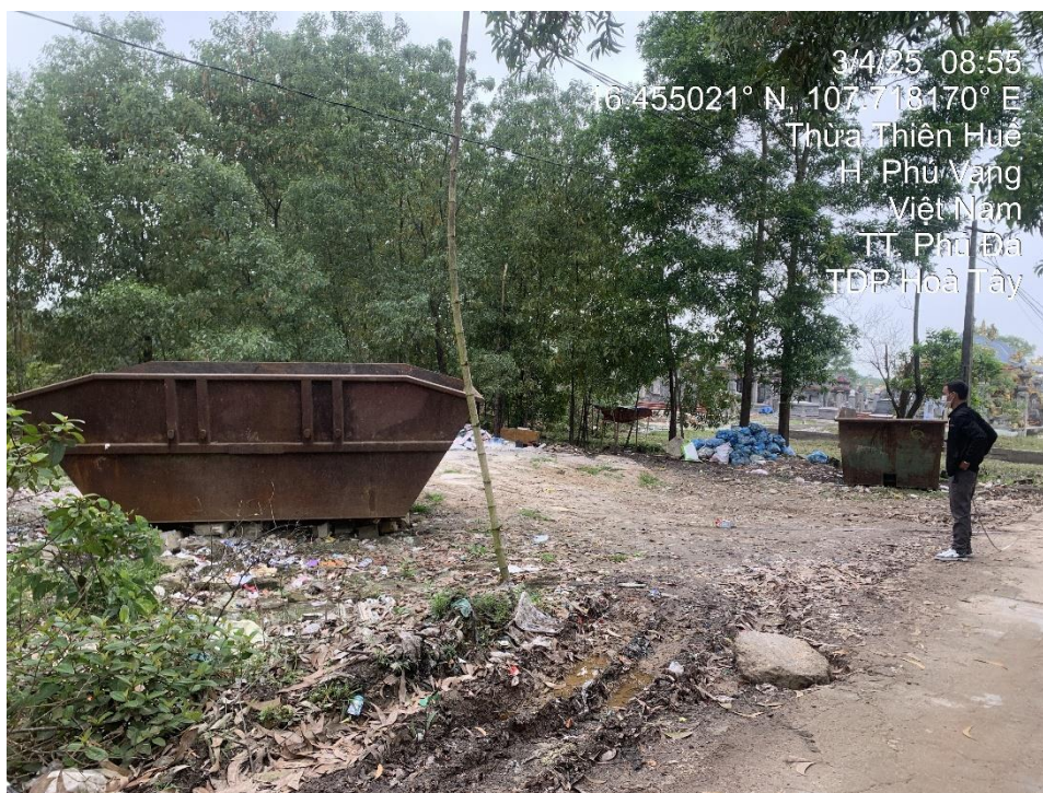
Điểm công trình 1: Tổ dân phố Hoà Tây, thị trấn Phú Đa