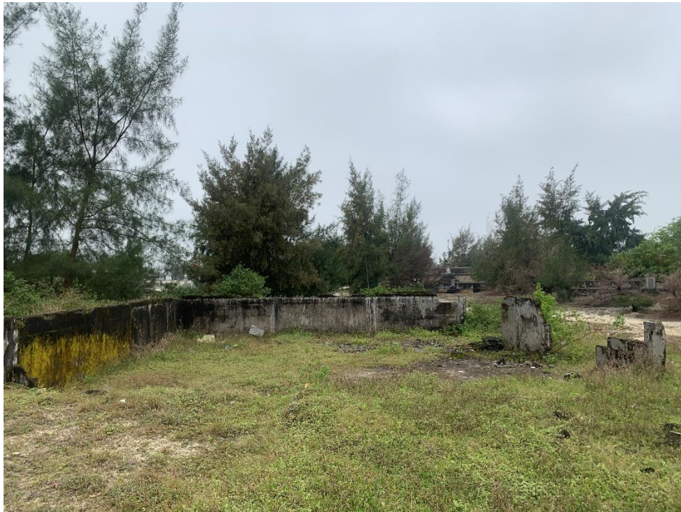
Điểm công trình 5: Thôn Tân Mỹ, xã Quảng Ngạn, huyện Quảng Điền