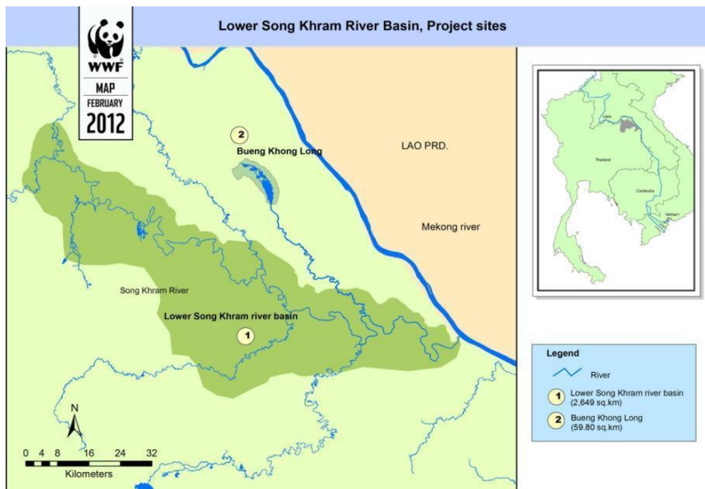
แผนที่แสดงพื้นที่เป้าหมาย และหมู่บ้านเป้าหมายการดำเนินกิจกรรมโครงการในลุ่มน้ำสงครามตอนล่าง